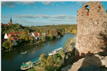
Blick von der Burg Giebichenstein